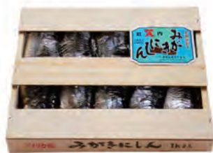
身欠にしん ソフト一夜干

小樽のイタリア料理店とコラボした簡単・絶品フィッシュボール。岩内産のトマトのソースでまるやかに仕上げた逸品。おかずやパスタで食卓に！