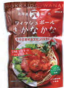
フィッシュボール さかなかな

にしんをオリーブオイル、ホエイ、岩内深層水で加工。パスタと季節の野菜をにしんのオイルで調理すれば、極上の一品が完成。もちろんそのままでも。