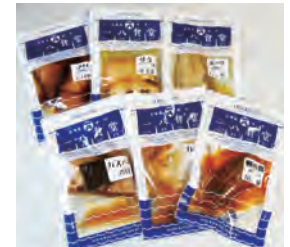
一八食堂 シリーズ

国産のにしんをじっくりと燻製風味の珍珠に仕上げました。お酒のアテに、袋をあげたらもう止められない！