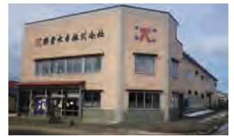
いつでもご来店お待ちしております。加工場隣接の直営店